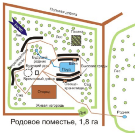
Родовое поместье, 1,8 га

положении находится весь наш народ, и скоро люди потянутся (уже тянутся) на землю, хочу поделиться своим опытом (сыном ошибок трудных) обустройства. И, в первую очередь, убедить, что для этого совсем не надо много денег. Деньги нужны для борьбы с природой, а для сотрудничества с ней часто достаточно просто понимания происходящих процессов. Озвучу и планы на сезон, тем более что есть конкретные возможности для сотрудничества со строительными и дорожными организациями и организациями ЖКХ.